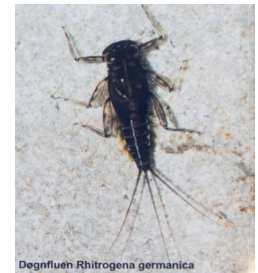
Døgnfluen Rhitrogena germanica

Som det eneste sted i Danmark lever døgnfluen Rhitrogena germanica i Højen Bæk. Den har en flad kropsform, der er tilpasset livet i det hurtigt strømmende vand. Døgnfluen har levet her, siden den indvandrede syd fra kort efter sidste istid. Man finder også over halvdelen af landets 25 slørvingearter i bækken, samme med døgnfluer og vårfluer.