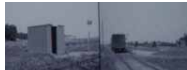
Svejgård trinbræt 1965

Volling Kirke består af apsis, kor og skib fra romansk tid. Byggematerialet er granitkvadre, Tårnet, der er opført af genanvendte kvadersten og fra kløvede marksten, er bygget i senmiddelalderen. Våbenhuset er yngre. Nordportalen benyttes endnu. Dens søjler er ret plumpe, nærmest ovale og kapitælerne bærer ret klodsede ornamenter. Søjleportalen er ikke Sallings prægtigste eksemplar, men viser dog, hvordan man har ladet sig inspirere både fra Viborg Domkirke og fra egnens andre kirker. En udskåret Kristusfigur fra 1400-tallet er en rest af kirkens sengotiske altertavle. I Volling kirke har man, som et af de få steder i landet, bevaret de levende lys i kronerne, som tændes hver gang kirken er i brug.