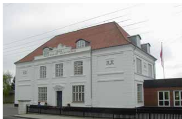
Ålestrup Realskole, opført 1904

Rabatter ved stierne bliver normalt ikke sprøjtet, hvorfor der er et flot flora og fauna.