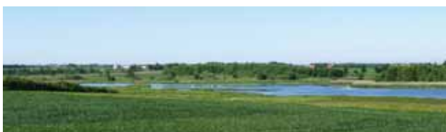
Øverst ses Spøttrup Middelalderborg. I midten ses "Polakkerhuset", hvor der er udstilling om Spøttrup Sø og egnen omkring Spøttrup Middelalderborg. Ved huset er fin rasteplads. Nedst ses den sydlige ende af Spøttrup Sø..