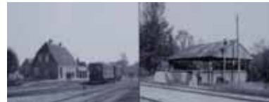
Balling Station 1965