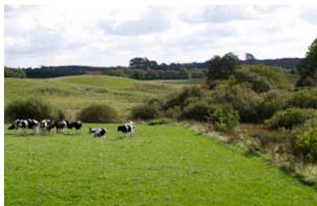
St. Hansted Ådal (nord for Horsens)