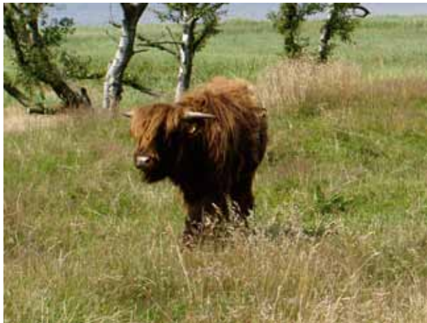
Skotsk højlandskvæg ved Halkær Bredning