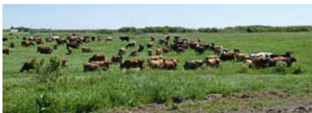
Landskab lidt nord for Lem

Der er ingen skove i Salling, men mange flotte levende hegn - typisk som markskel.