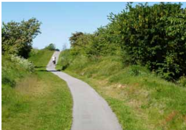
Banesti vest for Vejby