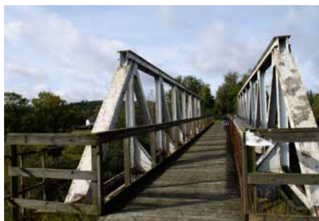
Jernbanebro over Funder Å og jernbanelinjen Silkeborg - Herning