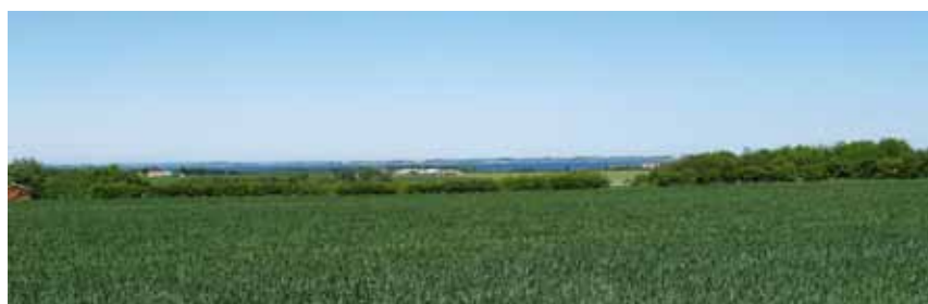
Udsigt fra banestien - lige syd for Rødding - det er Limfjorden i det fjerne