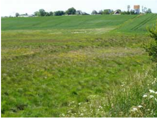
Meget smuk blomstereng ved Andrup Bæk - lige øst for Vejby (juni måned)