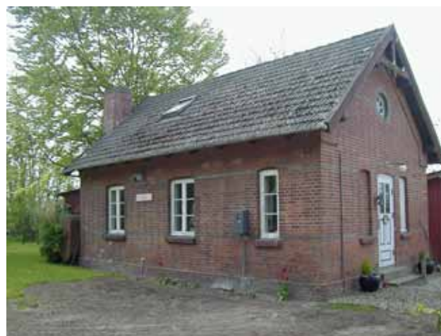
Østerbølle holdeplads (nord for Ålestrup)