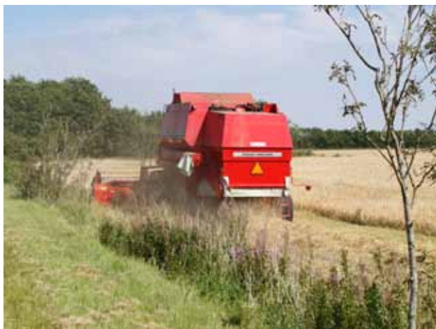
Høstarbejde ved Sunds (nord for Herning)

Husk: Det er aldrig vejret der er noget galt med - det er påklædningen! ... så glem ikke regntøjet.