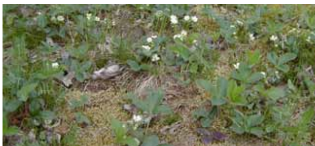
Skovjordsbær i blomst

På de kort der er ved hver banesti er der angivet nogle seværdigheder. Det er ikke alle seværdigheder der er vist, så besøg turistkontoret for at få oplysninger om den egn, hvor banestien forløber.