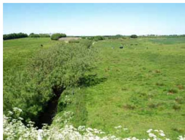
Spøttrup Kanal, eller Spøttrup bæk

Det anbefales at du gør et ophold i landsbyerne og ser på byernes ældre huse.