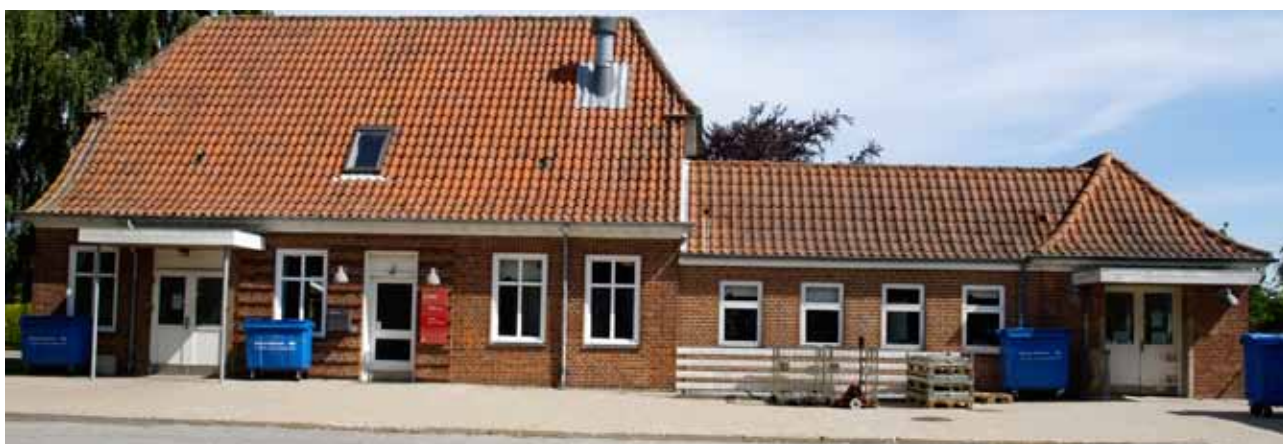
Den gamle stationsbygning i Balling - nu posthus