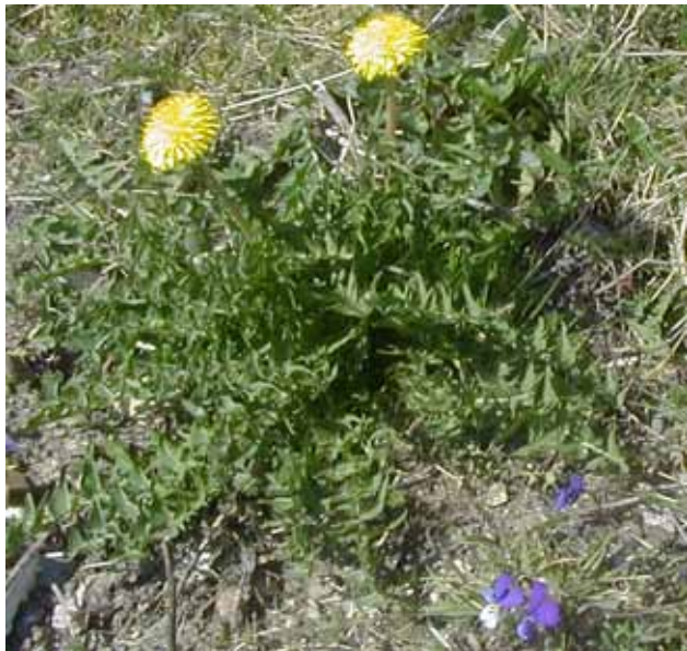
Forårsbebuder - mælkebøtte og vild stedmoder

Når vi har børnebørnene med på ture på de nedlagte banestier, bliver der spurg om meget. Så vi anbefaler, at du tager en håndbog med, så du kan