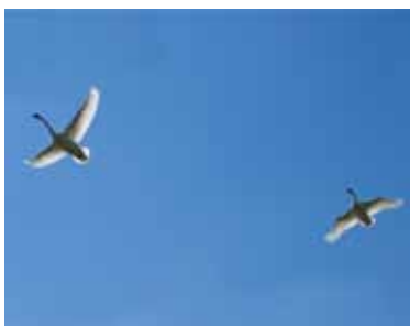
Svaner ved Halkær Sø

Ved de fleste banestier er der gode lokale informationer. Nogle af plancherne er gengivet ved beskrivelsen af banestierne.