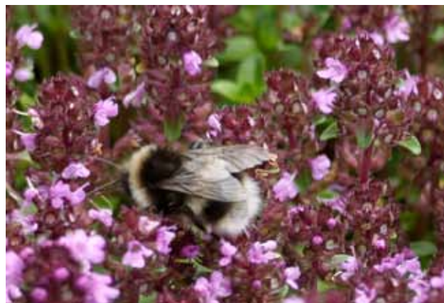
Humblebi i vild timian

Det vil også være en god idé at have druesukker og salttabletter med.