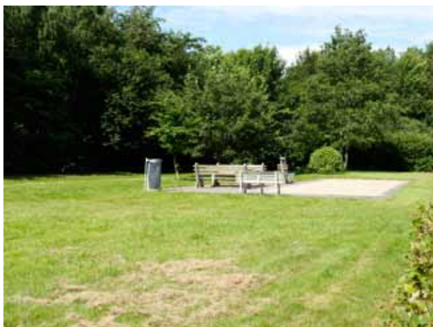
Rasteplass mellom Hem og Balling