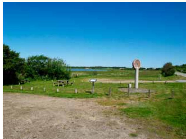
Skulptur for fred ved "Polakkerhuset"

"Store områder af Danmark lå hen som udyrkede arealer. Kortet fra Videnskabernes selskab fra 1700-tallets slutning viser, at kystegnene på Salling og Mors var fyldt med søer og strandenge. I Vestsalling finder vi Geddal Enge, Sønderlem Vig, Kås Sø, Spøttrup Sø, Hjerk Nor, Harre Nor, Grynderup Sø og Asted Sø. I Østsalling ligger Brokholm Sø, Lyby Sø, og Tastum Sø. På sydkysten af Mors var det ligeså: Tissingvig, Søndervig og Legind Vejle. Mange tusind hektar søbund lå klar til en landbrugsmæssig udnyttelse, men endnu var teknologien ikke udviklet godt nok til omfattende afvandinger. Det første forsøg med at få afvandet Spøttrup Sø kom omkring 1800, da borgen og hovedgården Spøttrup var kommet i Nissen-slægtens eje".