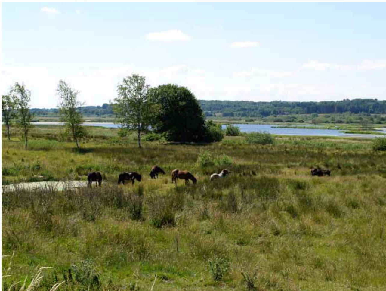
Halkær sø - set fra naturlejrplads (med shelters) ved Halkær. Få meter fra banesti Års - Nibe

Se også andre banestier på http://www.lgbertelsen.dk/Banestier.html