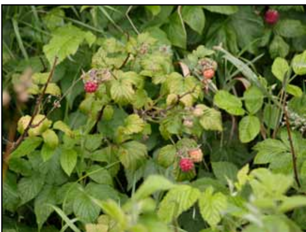
Ahhh ..., modne hindbær

Ved nogle af banestierne er der langt til nærmeste beboelse, så det er en god idé at have cykelpumpen og lappesager med. Det vil heller ikke være af vejen at have lidt værktøj med, så du kan udføre småreparationer - spørg din cykelhandler hvad der bør være i