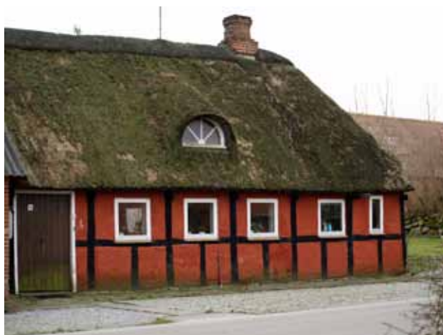
Landsbyhus i Velds (syd for Ørum)