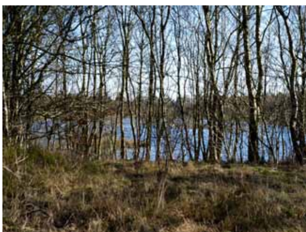
Sø mellem Them og Vrads, set gennem træbevoksning en vinterdag