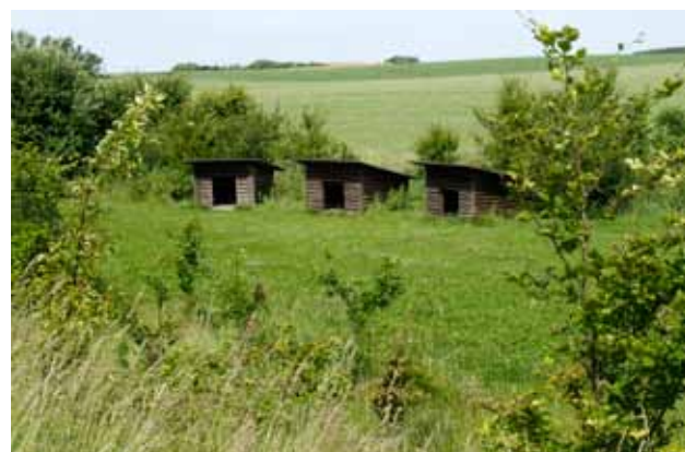
Shelters ved Hem