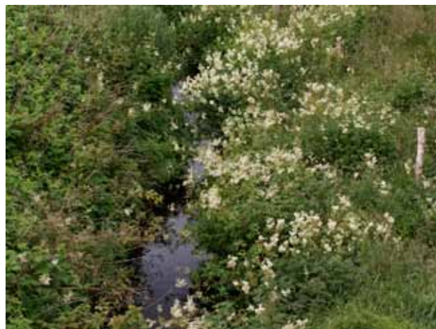
Mjødurt ved Herredsbæk (syd for Års)