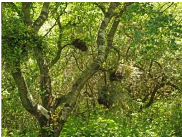
Naturen er underfuld - her "heksekoste" i birketræ lidt nord for Lem