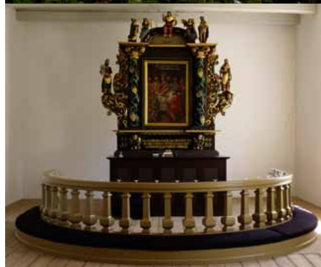
Hem Kirke og Alteret i Hem Kirke