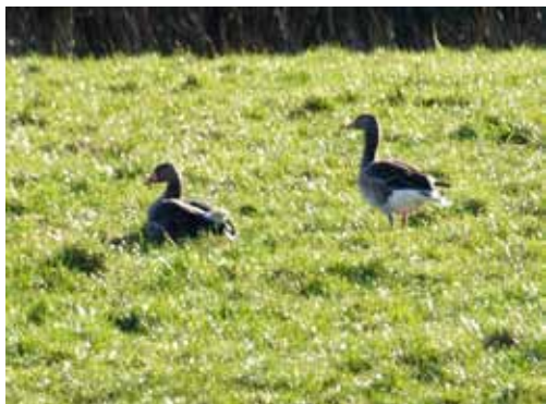
Gæs på mark nord for Vrads

Når vi har børnebørnene med på ture på de nedlagte banestier, bliver der spurg om meget. Så vi anbefaler, at du tager en håndbog med, så du kan