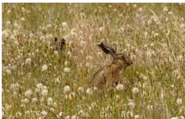
Harer i brakmark

Der kan ske uheld! Så vær forberedt med at have et par stykker plaster og en forbindelse med. Har du børn med på cykelturen og barnet vælter, kan et stykke plaster gøre underværker.