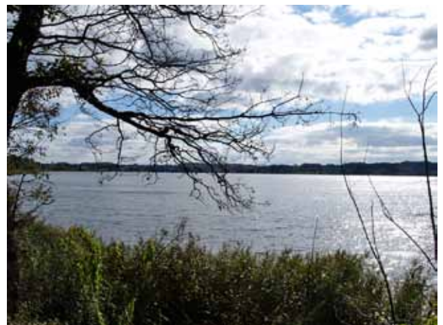
Efter løvfald, kan der „ses“ gennem træerne - her Hejls Nor

Smuk bygning i Hejlsminde, få meter fra Lillebælt.