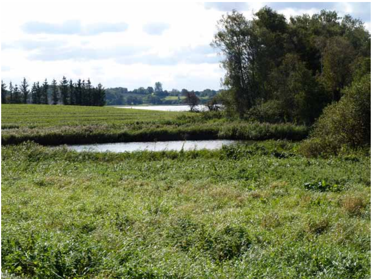
Vådområde tæt ved banestien med Hejls Nor i baggrunden

Lidt vest for Christiansfeld er er lille anlæg „Christinero“ - dette anlæg er et besøg værd. Tæt ved Christinero er Tyrstrup gl. præstegård med den ca. 400 år gamle bullade.