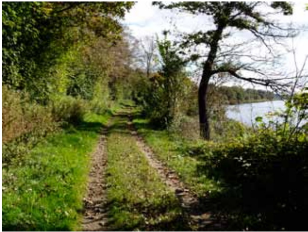
Banesti ved Hejls Nor