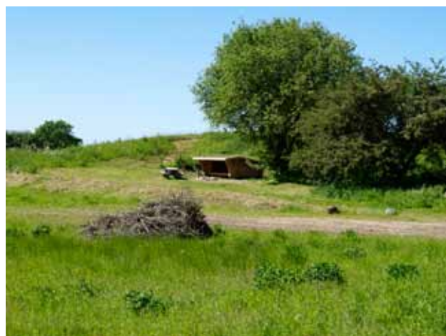
Naturlejrplads ved Ferup Sø