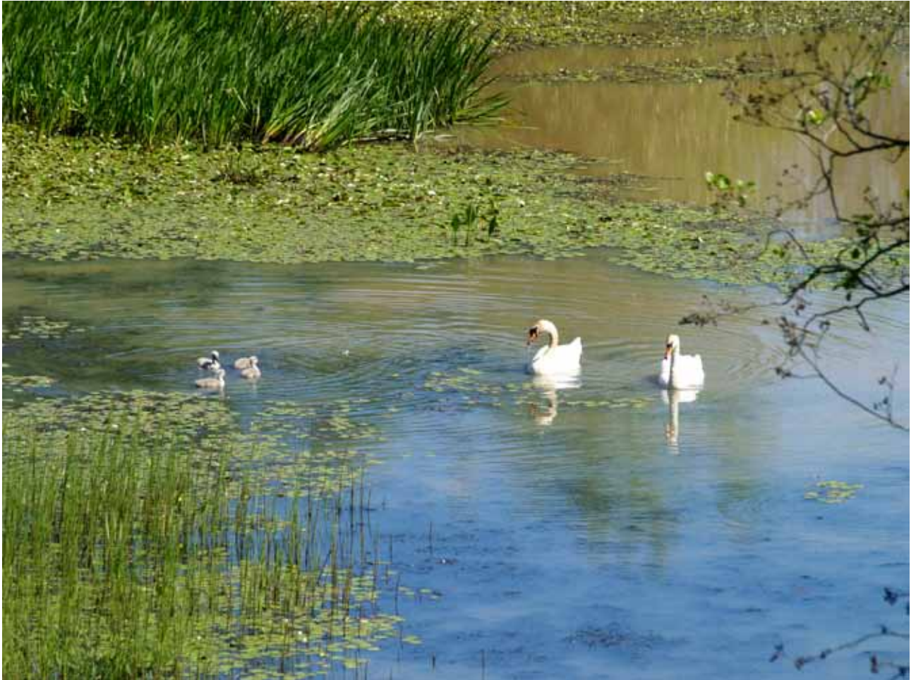
Svanepar med ællinger ved Ferup Sø