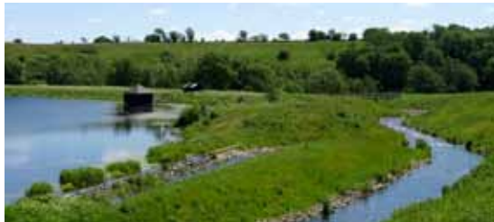
Overløbet ses forest til venstre - mellem Ferup Sø og vandløbet

Det nye omløbsstryg set mod syd fra et punkt over bandedæmningen. Til venstre ses overløbskanten fra Ferup Sø Syd. Langs dæmningen bagved overløbskanten ses det gamle slusehus og skuret, hvori afløbet til det nuværende stryg er. I baggrunden henover stryget er det indike-