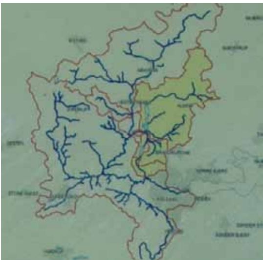
Oplandsfigur efter projekt

faunapassage henholdsvis før og efter realisering af projektet.