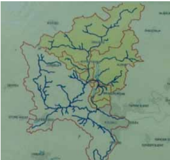
Oplandsfigur før projekt

Den gule baggrund viser, hvilken del af vandløbssystemet der er spærret for fri