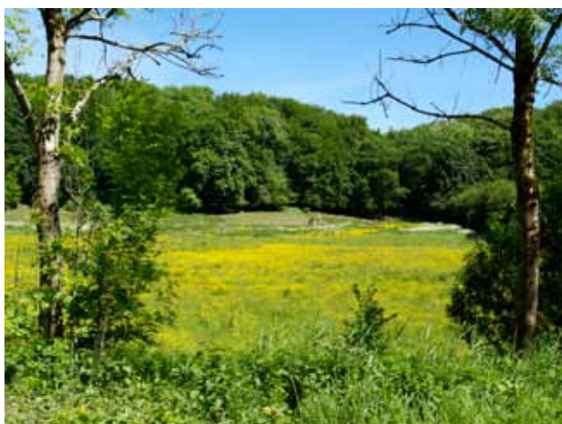
Eng ved „Skovløberhuset“

Der flyttes rundt på ca. 35.000 m 3 jord. Der bruges ca. 2.200 m 3 store sten til sikring af strygets profil. Der bruges ca. 330 m 3 grus til gydebunker og stenstryg.