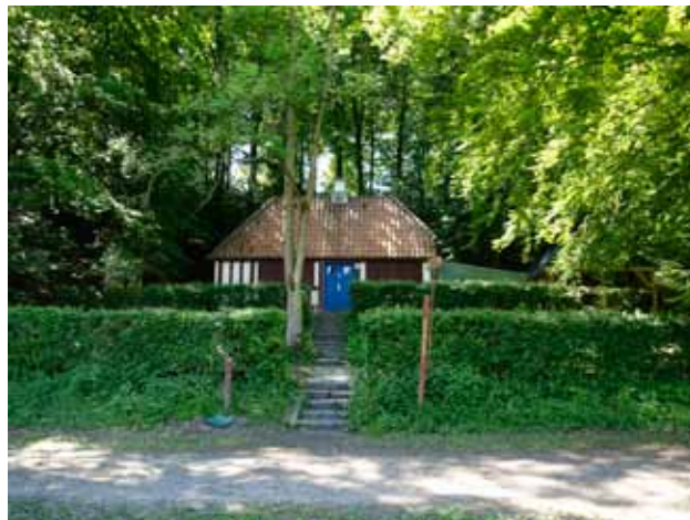
I det lille bindingsværkshus boede Kolding Kommunes skovløber indtil 1970.

Derefter har mange institutioner og skoler brugt huset til naturskoleformål, indtil den nye naturskole ved Marielundsvej blev bygget i 1991. Huset benyttes i dag som opholdssted for en skovbørnehave.