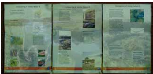
Øverst: Dybvadbro gl. station

Derefter har mange institutioner og skoler brugt huset til naturskoleformål, indtil den nye naturskole ved Marielundsvej blev bygget i 1991. Huset benyttes i dag som opholdssted for en skovbørnehave.