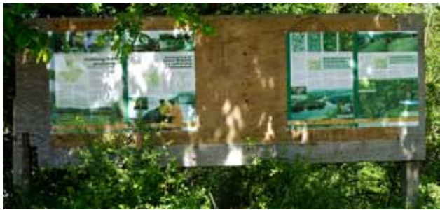
Plancher ved Ferup Sø om naturgenopretningen

Et omfattende „Naturgenopretningsprojekt“ omkring Ferup Sø, har skabt nye vilkår for flora og fauna, samt gode rekreative faciliteter.